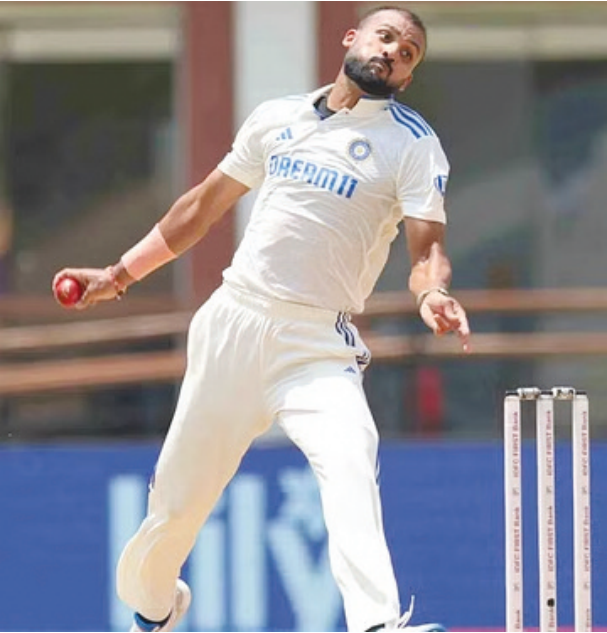
आकाश के लिए आसान नहीं रहा सफर

भारत के आकाश दीप बांग्लादेश के खिलाफ टेस्ट में अपनी गेंदबाजी से धमाल मचा रहे हैं। उन्होंने शुक्रवार को बांग्लादेश की पहली पारी में लगातार दो गेंद पर दो विकेट झटके। अपने दूसरे ओवर और बांग्लादेश की पारी के नौवें ओवर यानी लंच से ठीक पहले वाले ओवर में लगातार दो गेंद पर जाकिर हसन और मोमिनलु हक को आउट किया। आकाश ने नौवें ओवर की पहली गेंद पर जाकिर और फिर दूसरी गेंद पर मोमिनलु को क्लीन बॉलड किया। जाकिर ने तीन रन बनाए, जबकि मोमिनलु खाता भी नहीं खेल सके। आकाश का यह सिर्फ दूसरा टेस्ट मैच है। उन्होंने इसी साल फरवरी में इंग्लैंड के खिलाफ डेब्यू किया था और अपनी गेंदबाजी से इंग्लिश टीम को खूब परेशान किया था। उनका अंतरराष्ट्रीय स्तर पर शानदार प्रदर्शन जारी है। हालांकि, आकाश दीप के लिए यह सफर इतना आसान नहीं रहा है। आइए उनके संघर्ष की कहानी जानते हैं... इंग्लैंड के खिलाफ किया था डेब्यू 27 साल के आकाश दीप ने इंग्लैंड के खिलाफ इसी साल फरवरी-मार्च में पांच टेस्ट मैचों की सीरीज के चौथे मुकाबले में उतरते ही कमाल कर दिया था। उन्होंने इंग्लैंड की पहली पारी में शुरुआती तीन विकेट लेकर धमाल मचा दिया। आकाश को अनुभवी तेज गेंदबाज जसप्रीत बुमराह की जगह खेलने का मौका मिला था। आकाश ने कप्तान रोहित शर्मा के भरोसे को सही साबित किया और यादगार प्रदर्शन किया।