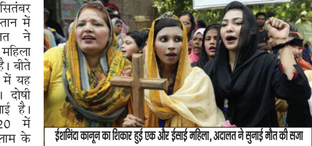
ईशनिंदा कानून का शिकार हुई एक और ईसाई महिला, अदालत ने मुर्दाई मौत की सजा